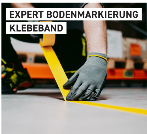
EXPERT BODENMARKIERUNG KLEBEBAND