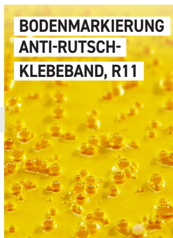
BODENMARKIERUNG ANTI-RUTSCH- KLEBEBAND, R11