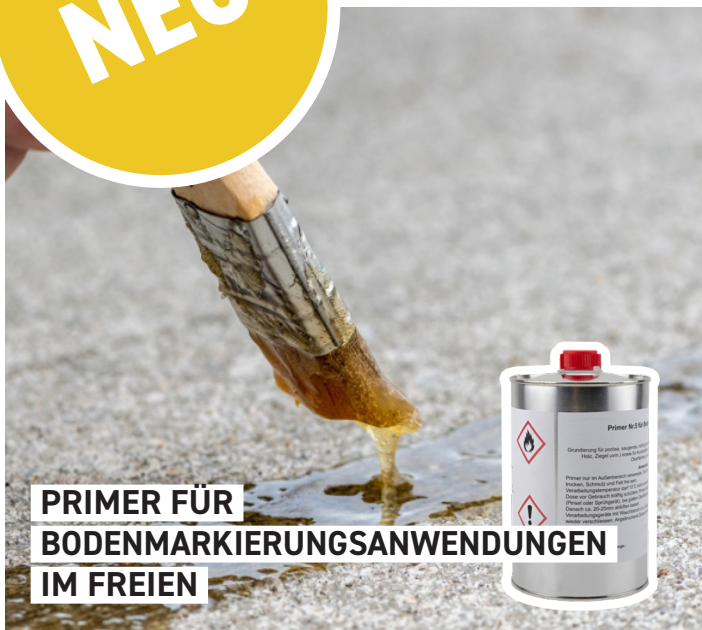
PRIMER FÜR BODENMARKIERUNGSANWENDUNGEN IM FREIEN